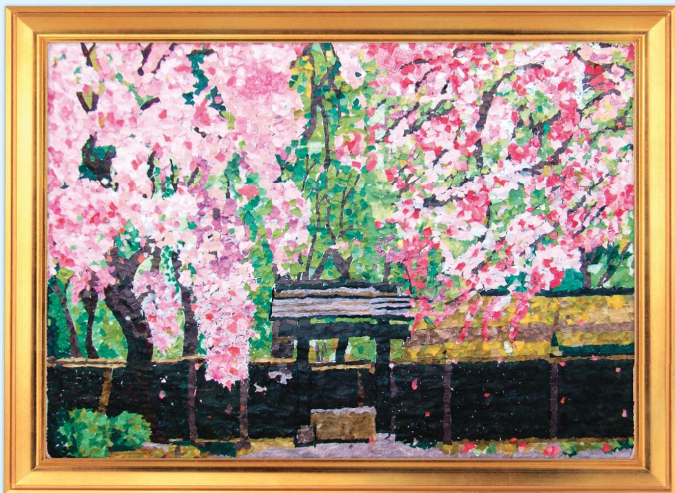
「秋田県角館 しだれ桜」(貼り絵)：老人デイサービス利用者製作

1階エレベーター横に展示されています。総合福祉センター(はあとぴあ)にお越しの際には、ぜひご覧ください。