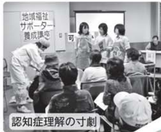
認知症理解の寸劇

この事業は、埼玉県社会福祉協議会「地域日常生活支え合い促進事業助成金」で実施しました。