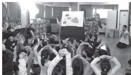
メリーママ パネルシアターお楽しみ会