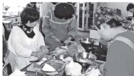
NPO法人 彩の会 ボランティアと一緒に調理中(会食)