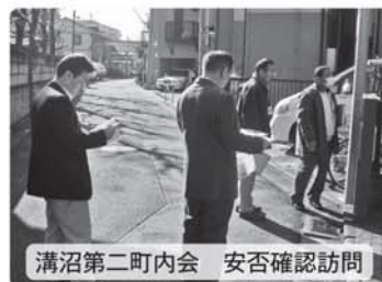
溝沼第二町内会 安否確認訪問