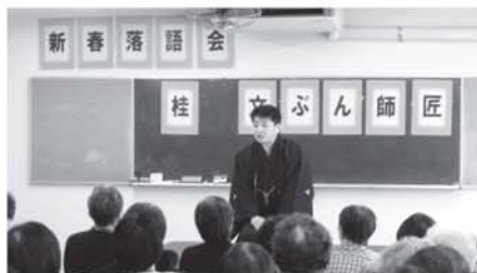
朝志ヶ丘いきいきサロン 新春落語会